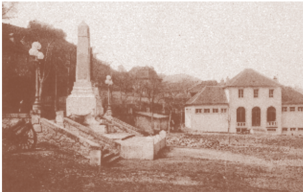
Monument aux Morts Archives municipales de Mende 10W11.

Si l'on tient compte du nombre de ses habitants, la Lozère a été le département de France le plus touché : environ 6 400 Lozériens ont perdu la vie, soit presque 5% de la population de 1911 (la moyenne française est à 3,5%). Parmi eux, figuraient environ 349 Mendois pour une ville qui comptait 7 000 habitants à l'époque.