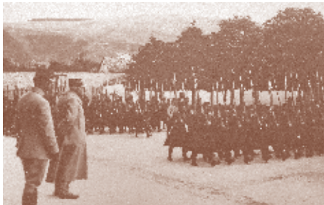
Défilé à Mende.

« La vie est de plus en plus chère. Le prix des denrées augmente sans cesse ainsi que le prix de toute espèce de choses. L'augmentation générale est d'environ 35%. Ce matin, sur le marché, sans l'intervention de la police, on en serait venu aux coups. »