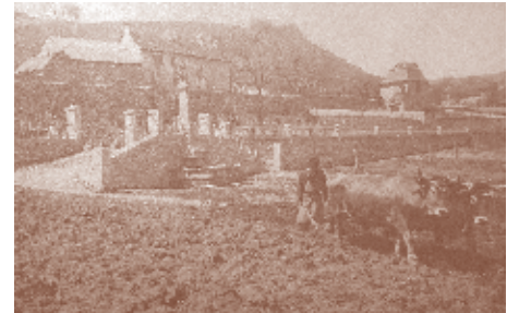
Labour sur le champ de foire en 1917 Bibliothèque municipale de Mende, Journal d'Emile Joly, p 316.

« Ce que je redoute le plus c'est, chaque matin, l'ouverture du courrier militaire qui porte les avis de décès ou de disparition des militaires aux armées. »