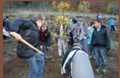
Plantation des arbres le 14 novembre 2013