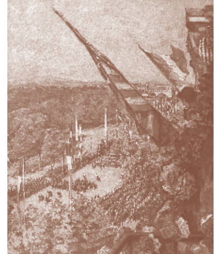
Jour de Gloire

Peinture à la gouache de Charles DUVENT, L'illustration, Album de la guerre (1914-1919), Paris, 19127, Tome II, p. 118.